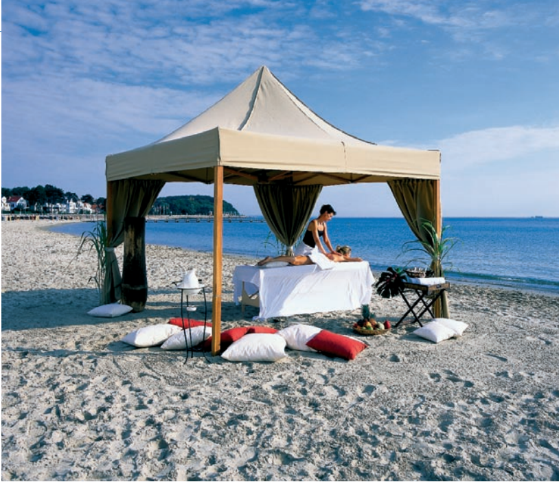
Die drei A-ROSA Resorts Kitzbühel (Abb. S.14), Travemünde (Abb. S.15 oben und unten) und Scharmützelsee (Abb. S.15 rechts) bieten herausragende Medical-Wellness Angebote.

Gesundheitsurlaub direkt zwischen dem MPCH und dem jeweiligen Resortarzt abgestimmt. Dieses bedeutet für den Gast optimaler Ertrag bei uneingeschränktem Urlaubserlebnis« freut sich Zur Weihen über die gelungene Kooperation.